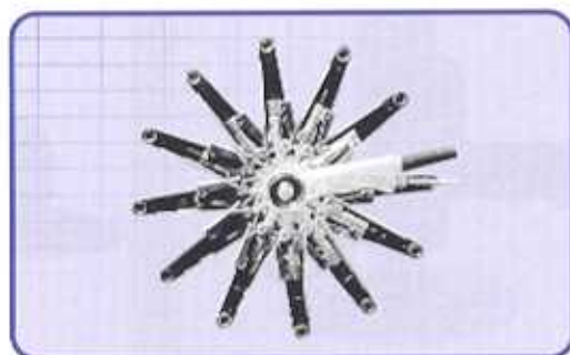
La testa dell'utensile può essere regolata per raggiungere la posizione desiderata